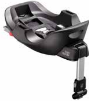
56 Základňa Flex pre detskú sedačku SUBARU Babysafe i-Size F410EYA310