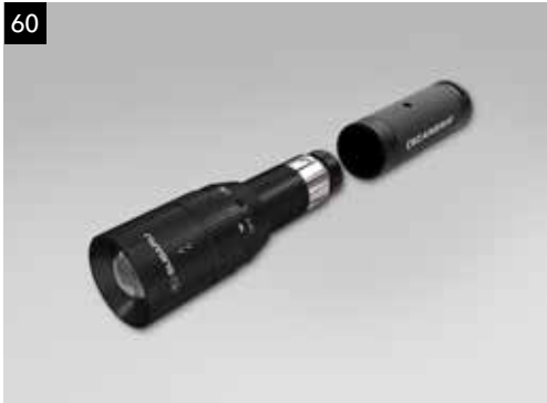
60 Dobíjacia baterka LED SESGFL1000

Dobíjacia baterka vreckových rozmerov, ktorá sa pripája priamo do zásuvky zapaľovača cigariet. Baterka má svetelný tok 130 lúmenov a dosah lúča 100 m, ako aj funkciu zaostrovania.