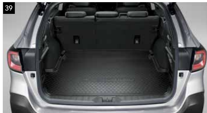
39 Plytká vaňa do batožinového priestoru

Poskytuje zvýšenú ochranu podlahy a stien nákladného priestoru pred prachom, nečistotami a tekutinami.