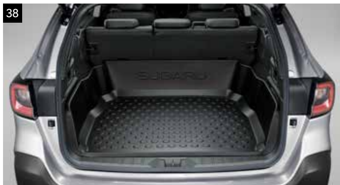
38 Hlboká vaňa do batožinového priestoru

Priehľadná fólia, ktorá chráni vrchnú hranu nárazníka pred poškrabávaním.