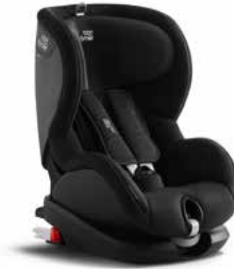
57 Detská sedačka Subaru Trifix 2 XP F410EYA250