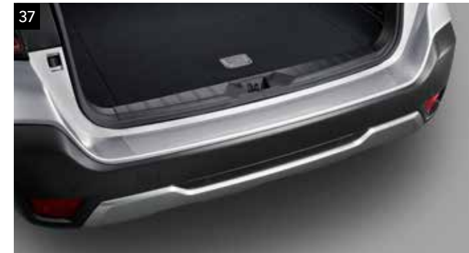
37 Ochranná fólia nakladacej hrany batožinového priestoru (priehľadná)

Kryt z nehrdzavejúcej ocele chráni zadný nárazník pred poškrabávaním.