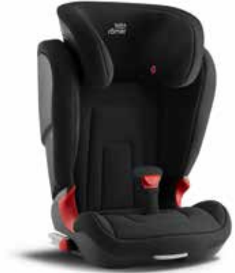
58 Detská sedačka Subaru Kidfix 2 R F410EYA260