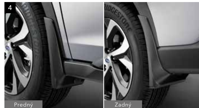
4 Súprava lapačov nečistôt

Zvýrazňuje dizajn bokov vozidla a podčiarkuje jeho terénny vzhľad.