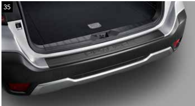
35 Ochranná nakladacej hrany batožinového priestoru (čierna)