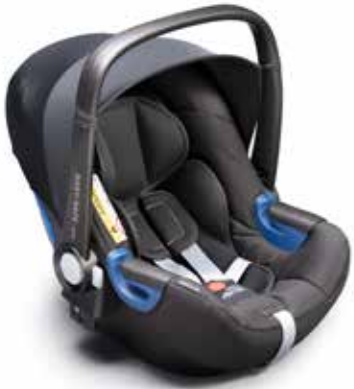
55 Detská sedačka SUBARU Babysafe i-Size F410EYA300