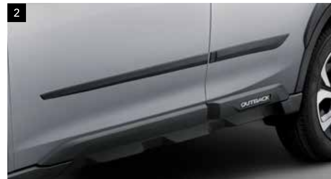
2 Bočná ochranná lišta

Dizajn mriežkovanej sieťoviny zo živice dodáva prednej časti úplne nový vzhľad. *Ak vozidlo nie je vybavené prednou kamerou, je potrebný kryt kamery.