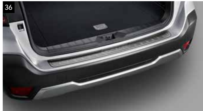
36 Ochrana nakladacej hrany batožinového priestoru (nehrdzavejúca oceľ)

Odolný plastový živicový kryt pomáha chrániť hornú hranu nárazníka.