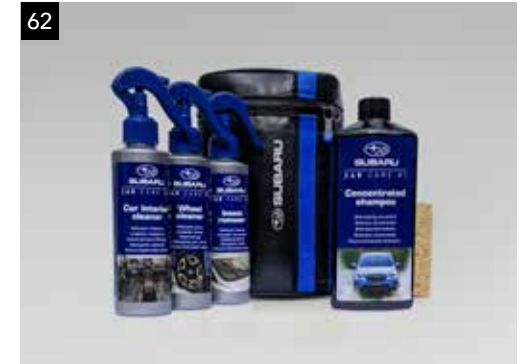
62 Súprava na kompletnú starostlivosť o vozidlo SEBAYA9000

Kompletná súprava starostlivosti o vozidlo obsahuje šampón, čistiaci interiér, čistiaci kolies, odstraňovač hmyzu a špongiu - všetko uložené v taške značky Subaru z umelej kože.