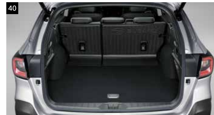
40 Zvýšená ochrana zadných sedadiel

Chráni podlahu nákladného priestoru pred prachom a nečistotami.