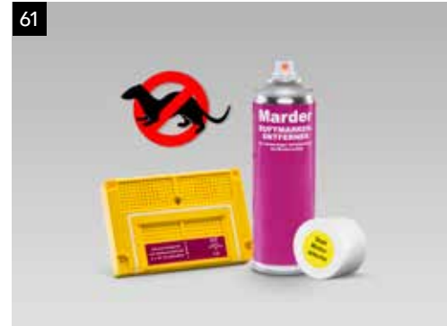
61 Ultrazvukový systém proti kunám SEGOYA9000

Súprava obsahuje sprej na odpudenie kún a ultrazvukové zariadenie, ktoré pomáha predchádzať poškodeniu v motorovom priestore spôsobenému kunami.