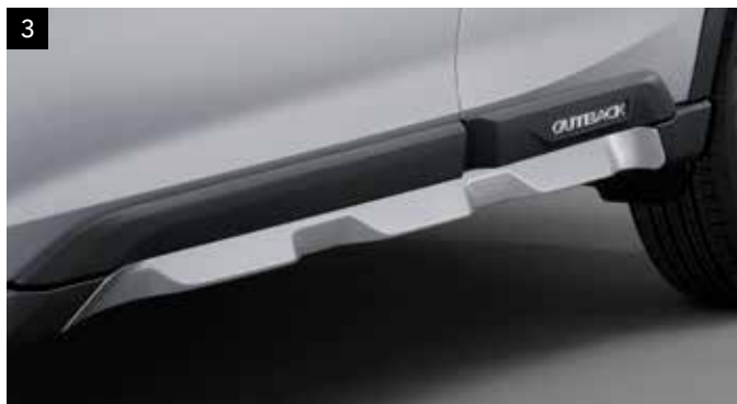
3 Ochranná lišta prahov (živicová)

Zvýrazňuje dizajnové prvky a chráni bok karosérie.